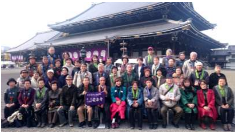
本山御影堂前で参拝記念写真

今回の団体参拝に参加されましたご門徒等の皆様のご協力をいただき、無事参拝できましたこと感謝申し上げます。来年の報恩講も、ぜひご予定下さいますよう、宜しくお願ひ致します。