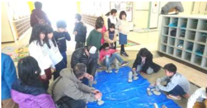
子供たちとのゲームの様子

二〇一一年三月十一日、東日本大震災が起こつて、もうすぐ七年になります。少しづつ復興していく中ニュースでもあまり報道されなくなつた今、人々からの記憶も薄れていつているような気がしてなりません。でも、まだまだ原発の問題など、解決どころか増えているような現状がみられます。