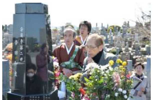
永代供養墓での彼岸法要

永代供養墓には、五十名を越す皆様がお参りされました。お勤めをする中、参拝者お一人お一人に亡き方々を偲んでお焼香をしていただきました。