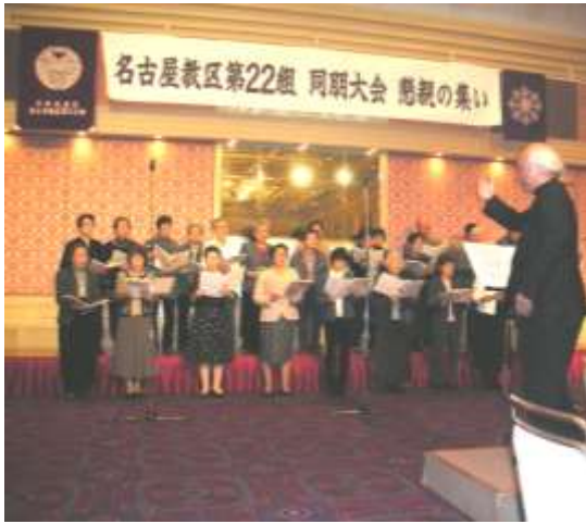
熱唱する(百花繚乱)の皆様

休憩の後、参加者の皆様と懇親会会場に移動し、最初にアトラクションとして、二十二組のコーラス(百花繚乱)による「竹田の子守歌」「バラバラでいっしょ」の合唱の披露があり、その後、懇親会が開催されました。